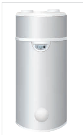
EDEL AIR modèle au sol