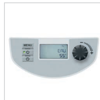
Panneau de commande