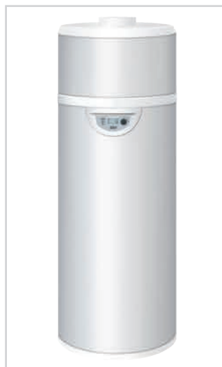
EDEL AIR modèle mural