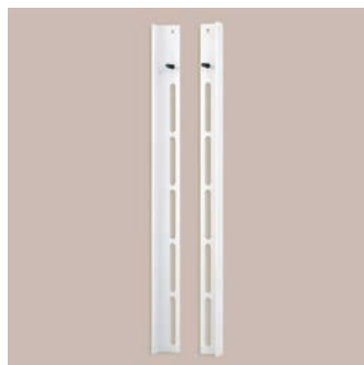
Étriers de transfert