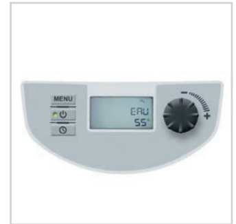
Panneau de commande